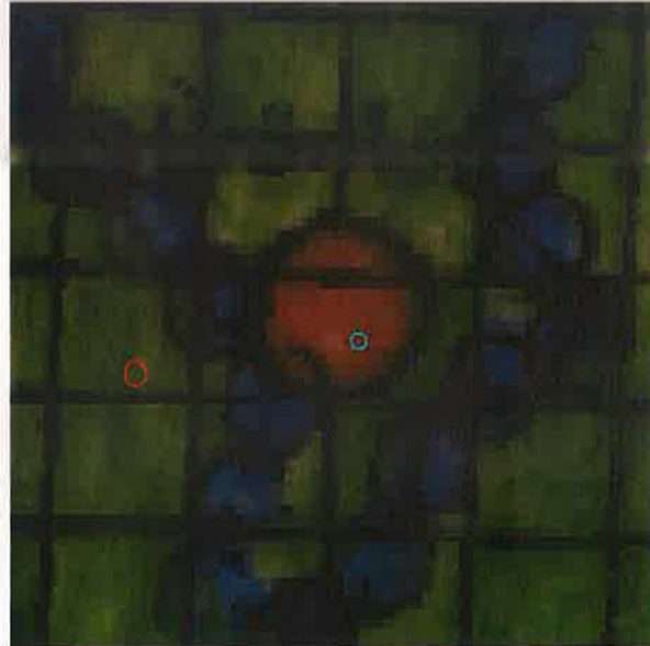
Resim 4: 1/100.000 Ölçekli Çevre Düzeni Planı

Ürünlü Mahallesi 2721 ada 13 ve 14 parseller, Bursa 2020 Yılı 1/100.000 Ölçekli Çevre Düzeni Planı'nda "Mevcut Kırsal Yerleşimler"alanı'nda kalmaktadır.