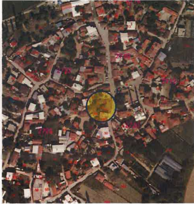
Resim 1: Uydu Görüntüsü

Plan değişikliği yapılan alan, Ürünlü Mahallesi'nde Ürünlü caddesi üzerinde bulunmaktadır.